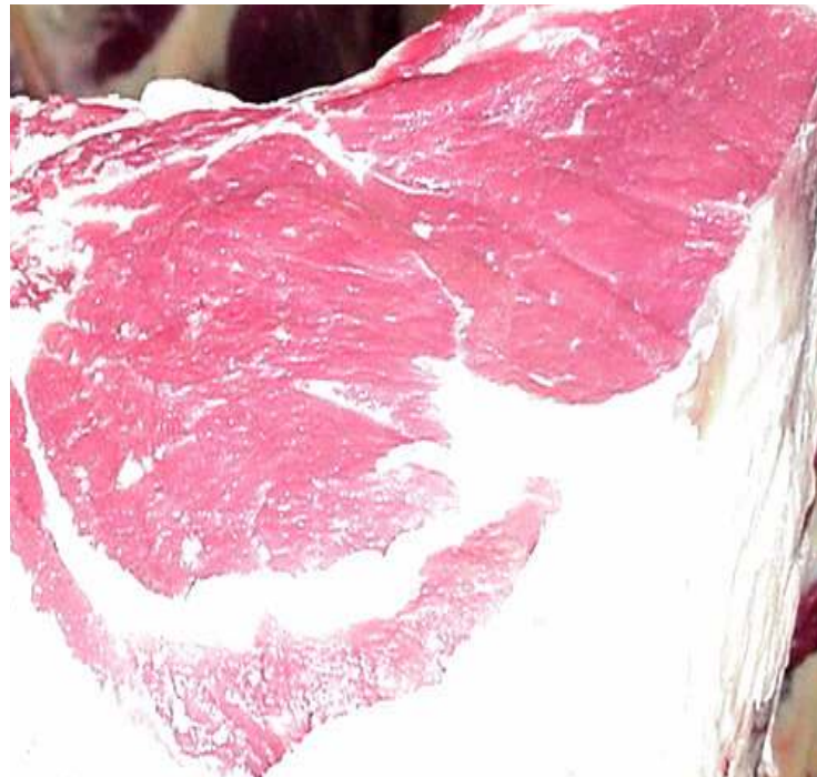
Lomillo de toretes engordados bajo pastoreo rotacional y procesados a 26 meses de edad.

(Akalin y Tokusoglu, 2003; Belury, 1995; Doyle, 1998; Parodi, 1997 ). Si bien ésta es una buena noticia, queda aún por determinar cuánto de ese 10.15% de AG linoleico presente en la grasa de la carne de res de PR está en su forma conjugada (CLA). Esta determinación es necesaria debido a la importancia que este último está cobrando por sus efectos favorables a la salud.