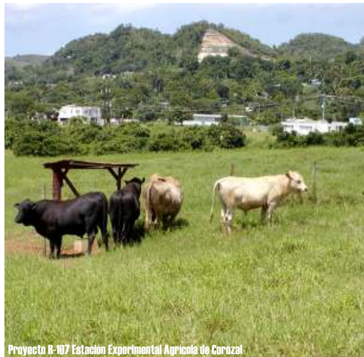
Proyecto R-107 Estación Experimental Agrícola de Corozal

“En la Isla la unidad principal de producción es el macho entero que se recria y engorda en sistemas de alimentación donde predomina el consumo de forrajes con un uso mínimo de granos o concentrados”